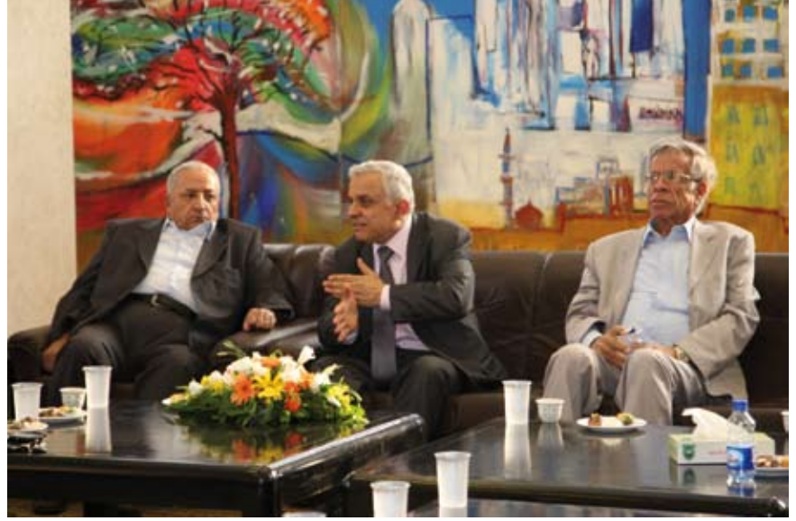
السيد يتحدث في الندوة

وقدم الحضور من إعلاميين وكتاب ومتقنين مداخلات حول العلاقة بين الدين والدولة ودور قضايا عربية وإسلامية منها القضية الفلسطينية في الفكر الإسلامي وسلوك الحركات الإسلامية الذي يختلف عن فكرها.