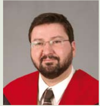
عميد معهد دراسات الإسلام المعاصر الأستاذ الدكتور عبدالله زيد الكيلاني التخصص: الفقه وأصوله / الجامعة الأردنية