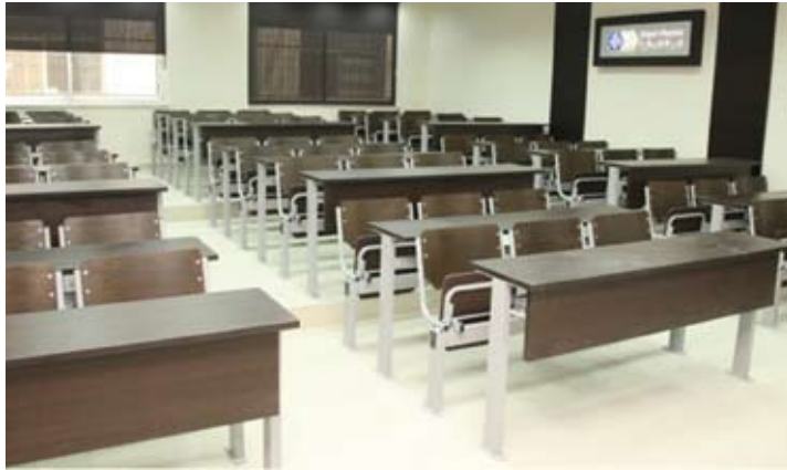
القاعات الجديدة في كلية الصيدلة

الجديدة توفر أجواء من الراحة للطلاب والمدرّس، وأن ذلك سيساهم في رفع السوية العلمية للطلبة.