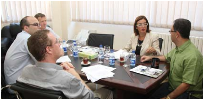
جانب من الورشة

آثار عميقة على موضوعات المواطنة وحقوق الإنسان والعمالة المهاجرة. من جهته أشار مدير مركز دراسات الشرق الأوسط لجامعة جنوب الدنمارك الدكتور بيتر سيبرج أن للربيع العربي أثر على الأبعاد غير التقليدية للأمن المرتبط بالهجرة من حيث قدرة الدولة على السيطرة على مواطنيها أو المهاجرين إليها أو إسهام العائدين إليها.