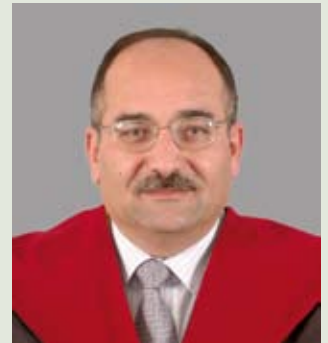
عميد كلية العلوم الأستاذ الدكتور فؤاد أسعد كتانة التخصص: التحليل الدالي / جامعة انديانا