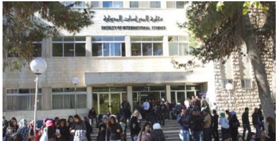
كلية الدراسات الدولية