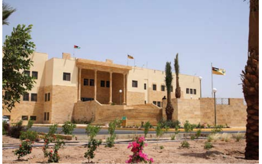
الجامعة الأردنية فرع العقبة

أن رسالة الجامعة تركز على ثلاثة محاور رئيسية هي: التدريس، والبحث العلمي، وخدمة المجتمع. وعلى صعيد البحث العلمي قال الشرايعة إنه تم نشر عدد من الأبحاث العلمية في مجالات محكمة ومعتمدة عالمياً، وأن هناك عدداً آخراً من الأبحاث قيد النشر، وتم تنظيم مؤتمر عالمي. وأشار الشرايعة إلى أنه تم تحقيق عدد من الانجازات منها إطلاق برنامج الدبلوم العام في تكنولوجيا المعلومات والاتصالات في التربية، وعقد دورات في الرخصة الدولية لقيادة الحاسوب (ICDL)، والبرمجة المتقدمة ودورة (Oracle).